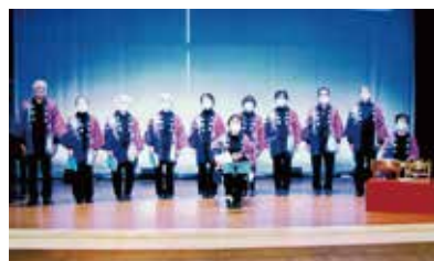
入管地域交流センター 映像展示 狭山市民謡協会 (民謡 千草会)