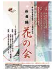
市民会館会場 狭山市新舞踊連盟