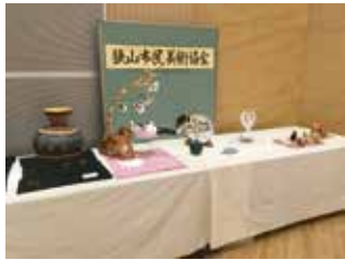
中央公民館 作品展示 (一部) 狭山市民美術協会

狭山市の市民会館や各公民館等を会場として、今秋二年ぶりに市民文化祭が開催されました。今回は感染症拡大防止対策として、作品展示を主体とし、舞台イベントの代わりに映像展示での開催となりました。当連合会所属の各団体でも、それぞれ工夫しての参加が見られました。