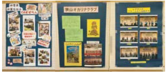
中央公民館 映像展示 狭山オカリナクラブ ブルースカイ