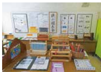
広瀬公民館 展示 狭山遊系会