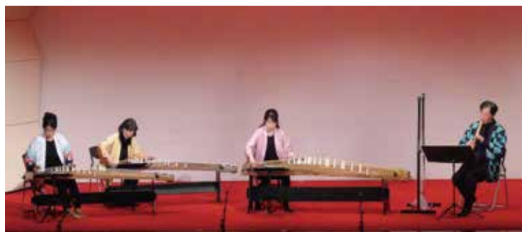
鬼滅の刃オープニング曲「紅蓮華」の演奏