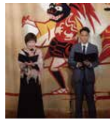
英語通訳付きの司会

第44回 狭山市三曲連盟定期演奏会は、昨年43回の中止の後、満を持しての準備開始から丸1年… 各教室も開店休業状態が続き、この機会に我々最大の目的である邦楽普及としてのコンサートを組み込み、会場に来られるのが困難な方、また日本の伝統音楽に触れる機会の少ない外国の方にも観て、聴いていただけるように、英語での解説も加え YouTube 発信を企画致しました。県の文化振興基金の助成をいただき経費不足も何とか解消でき、本年10月31日(日) 狭山市民会館小ホールにて、ようやく実現可能となりました。