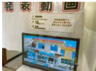
奥富公民館 映像展示 ラフォーレ・アンサンブル