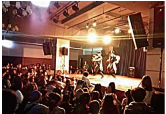
熱気あふれるライブ会場

15周年という記念すべき節目に「若者による活気あるイベントを！」という強い想いを横山会長より仰せつかり、狭山市駅西口にオープンしたばかりの「LIVE STATION sayama」にて15周年記念事業「茶楽茶楽フェスタ2014」を開催させていただきました。スポットライトを浴びながらキラキラした笑顔で生き活きと踊る子ども達、そして老若男女自然と心が躍り出すプロのミュージック。ダンスと音楽の融合した空間を、若者だけでなく大人までもが一緒に楽しむことが出来たイベントとなりました。