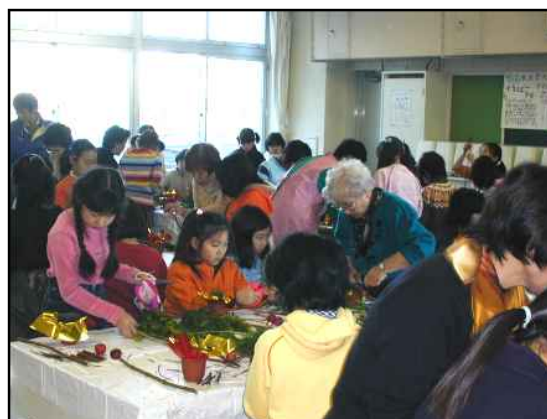
第5回文化体験フェスタ(昨年12月)

「青少年文化体験フェスタ」は、小・中学生が伝統文化等のさまざまな文化活動を早期に体験し、子ども達との交流を通じて、地域文化の普及と発展を図ることを目的とした、文団連発足以来の自主事業です。今回は新たに「着装」の分野が加わり、多彩な文化体験ができるよう14団体が指導します。